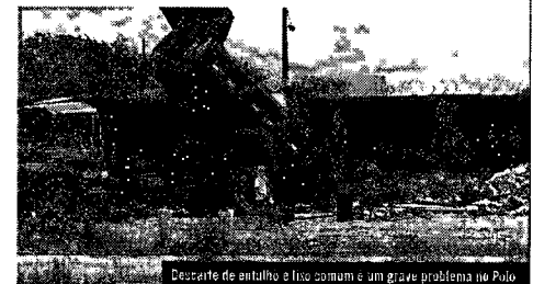
Descarte de entulho e lixo comum é um grave problema no Polo